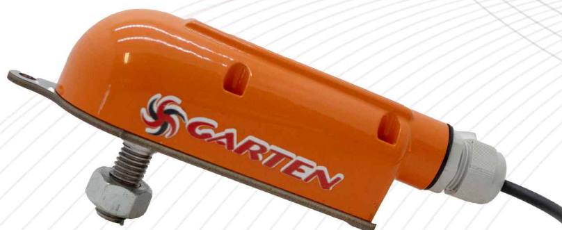
Sensor de movimento

O Sistema de Monitoramento Sheriff é a escolha inteligente para garantir a eficiência, a segurança e a produtividade da sua operação.