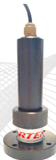
Sensor de embuchamento