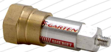
Sensor de temperatura.