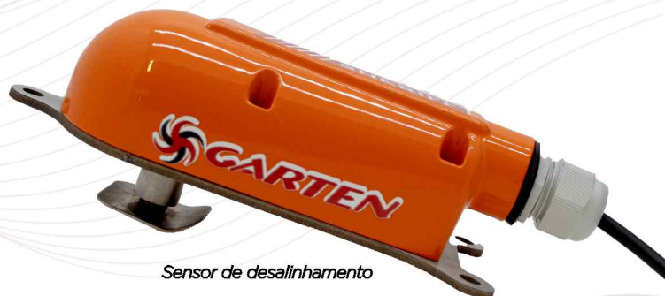
Sensor de desalinhamento